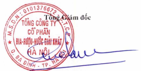
Ngô Quế Lâm